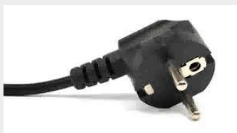
220 V; 1 fase aansluiting

Elektrisch koken kan met een 1-fase aansluiting of met een 2-fase aansluiting. Het verschil in aansluiting is hieronder weer gegeven. Het voordeel van een 2-fase aansluiting is dat de kookplaat beschikt over twee keer zoveel vermogen als bij een 1-fase aansluiting. De leden van de Klankbordgroep hebben hun voorkeur uitgesproken voor het maken van 2-fase aansluitingen in de woningen aan de Plejadenlaan. Dit gaan we in de praktijk toepassen.