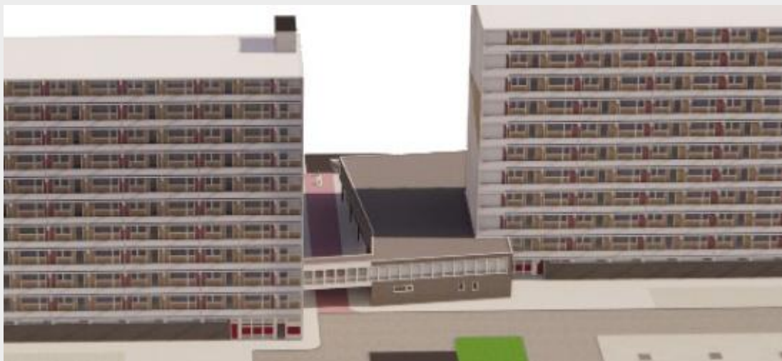
Afbeelding bestaande situatie met loopbrug

Op basis van eigen onderzoek en verzamelde informatie is het besluit genomen dat de architect, bij het maken van de plannen, rekening kan houden met het verwijderen van de loopbrug.